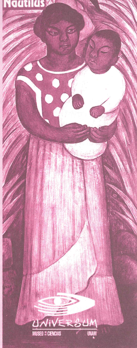
Diego Rivera, detalle de los murales de la SEP

Educación sexual para madres, padres, maestras y maestros